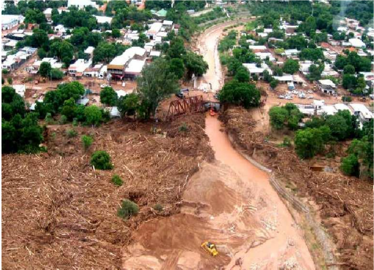
FIGURA 2.- Vista del cauce del río Tartagal y puente ferroviario caído

Los graves problemas sociales ocasionados por este desastre merecen un capítulo aparte, por la desolación, las pérdidas materiales, los problemas sanitarios, la precariedad de los evacuados, dramas que recayeron mayormente en población de escasos recursos sin capacidad de autorrecuperación.